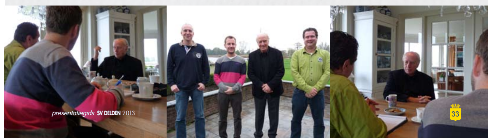
presentatiegids SV DELDEN 2013